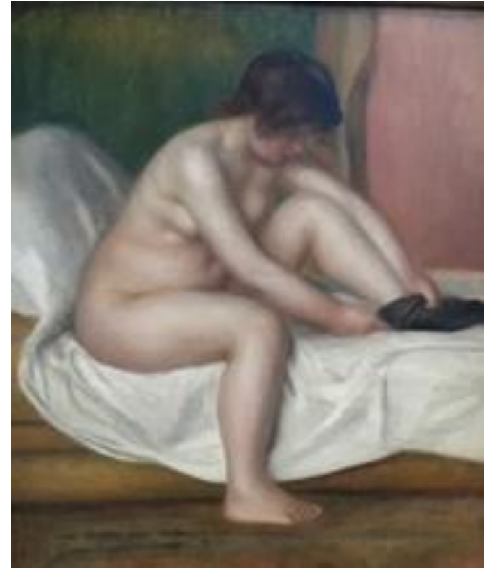
Nude - Pierre Auguste Renoir (Philadelphia Art Museum)

İnfeksiyon Hastalıkları ve Klinik Mikrobiyoloji A.D.